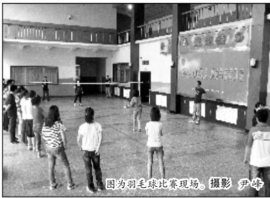
图为羽毛球比赛现场。

纸、网络、电视、橱窗等媒体,通过组织召开座谈会、主题团日等多种途径和方式,结合中铝公司团委纪念建团90周年暨“五四”青年月系列活动,大力宣传胡锦涛总书记“五四”讲话的重大意义和精神实质,要把学习讲话精神作为今后一段时间团员青年理论学习的主要内容,作为开展“高举团旗跟党走”形势政策教育活动的专题,迅速掀起学习宣传和贯彻落实讲话精神的高潮;同时,要把学习贯彻讲话精神与企业生产经营、运营转型、创先争优等实际工作紧密结合起来,齐心协力,迎难而上,为企业全面实现“十二五”各项目标任务贡献青年群体的力量。(樊海啸)