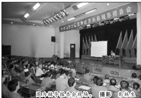
图为辅导报告会现场。

沈骥如,中国社会科学院世界经济与政治研究所国际战略研究室研究员、博士研究生导师、中国国际文化交流中心理事、中国欧洲学会理事、中国欧盟研究会理事,主要从事国际战略、大国关系和地区经济一体化合作研究。主要著作有《欧洲共同体与世界》、《中国不当“不先生”——当代中国的国际战略》,另有《论21世纪的中美关系》、《欧元的现状和未来》、《国际战略与恐怖主义》、《世界格局是否会变》等论文百余篇。