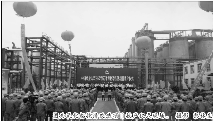
图为氧化铝挖潜改造项目投产仪式现场。