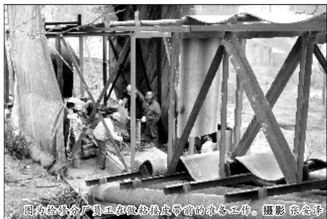
图为检修分厂员工在做抬接皮带前的准备工作。

石灰石矿2600米斜井输送带更换工程,是检修分厂、晋铝建安公司实行一体化运作以来于今年2月中标的重要项目之一。因氧化铝生产条件所限,大修工期要求45天完成,而历史上二十三冶大修工期是100天。分公司领导高度重视,亲自点将,将这堆硬骨头交给能打硬仗的修造车间,并决定集分厂之人力物力全力支持,只许胜,不许