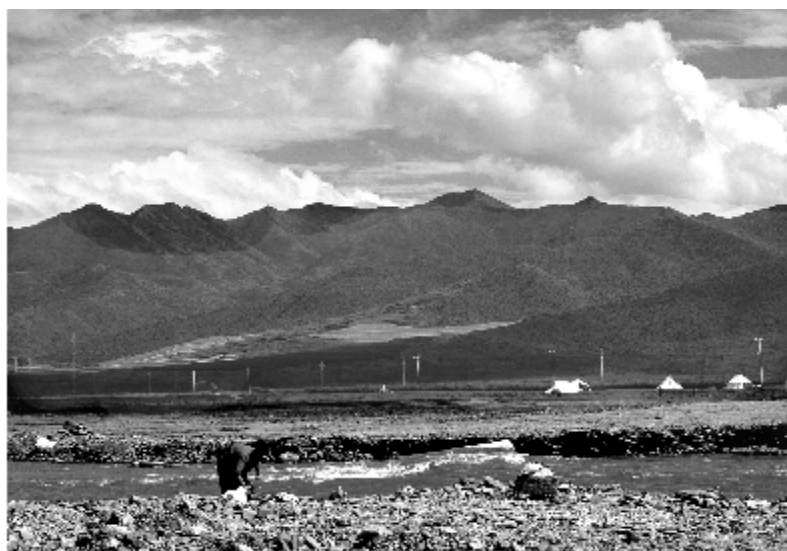
高原风光