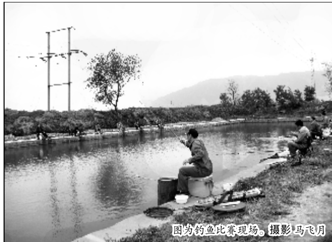
图为钓鱼比赛现场。