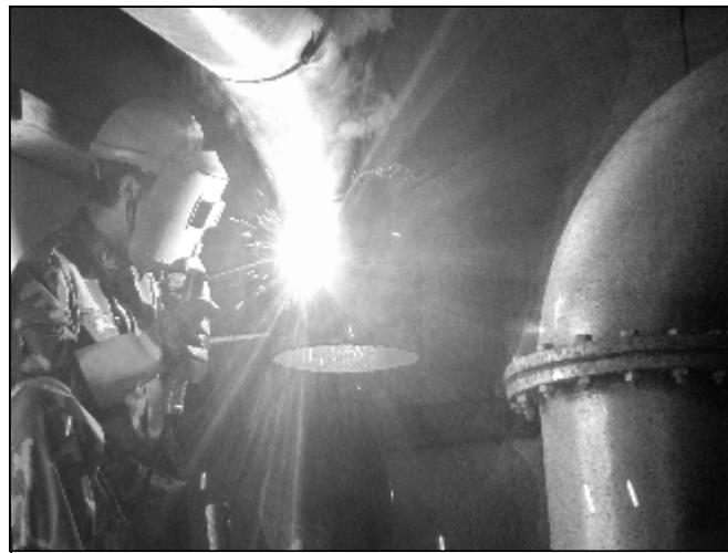
图为热电分厂检修车间员工正在焊接管道。

4月19日自龙门山传来捷报,由检修分厂承担的石灰石矿2600米斜井输送带更换任务历时30天胜利凯旋,工期提前半个月,取得一次试车成功,确保了氧化铝高产和挖潜增效项目投产石灰石供料高枕无忧。检修分厂一路过关斩将捷报频传,整个工程令人信服地成为大修典范,大修工期、施工技术均创历史之最。