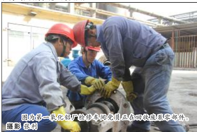
图为第一氧化铝厂检修车间党员正在回收废系零部件。

“企业发展就像逆水行舟,不进则退,党组织更要发挥好战斗堡垒作用,党员更要站出来,引领广大员工战胜困难,劈浪前行。”在一次政工例会上,第一氧化铝厂党委书记奎壮如是说。目前,氧化铝市场形势进一步恶化,面对恶劣的市场环境,分厂党委多次在各种会议中呼吁加强党组织的凝聚力和向心力,进一步增强员工战胜困难的信心和勇气,形成了统一的认识。