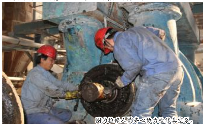
图为检修人员齐心协力检修真空泵。

从3号到5号，三天的时间里，检修人员每天都要工作近十个小时，经过连续的紧张施工，10月5号晚上7点，检修人员才结束了对B泵的检修工作。所有人焦急地等待着试车结果，“数字调试正常，运转正常！”大家终于松了一口气。“一会加班修理C泵，大家现在赶紧吃饭。”每个人抽空拿起手机给家人打了声招呼，在食堂简单的吃了晚饭，顾不上休息，立即又投入到紧张的施工中。