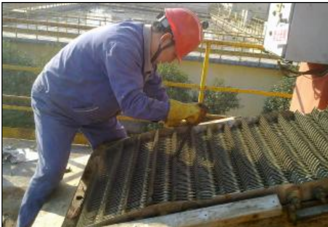
水电分厂排水车间一线党员把生活污水处理设备缺陷做为消除浪费改善点，针对以前每次检修需要更换200-300个耙齿的状况，技术人员通过给捞渣机加装不锈钢挡板，解决了杂物将捞渣机耙齿卡坏需频繁检修的问题，促进了污水处理指标的持续优化。