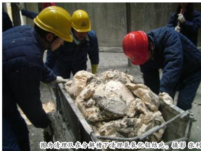
图为清理队在分解槽下清理氢氧化铝结疤。

“这次我们又是第一!”在车间绩效公开栏里一队一班的绩效工资,让其他班组艳羡不已。这次,一队一班接受了沉降车间分级机岗位清理任务。(下转第二版)