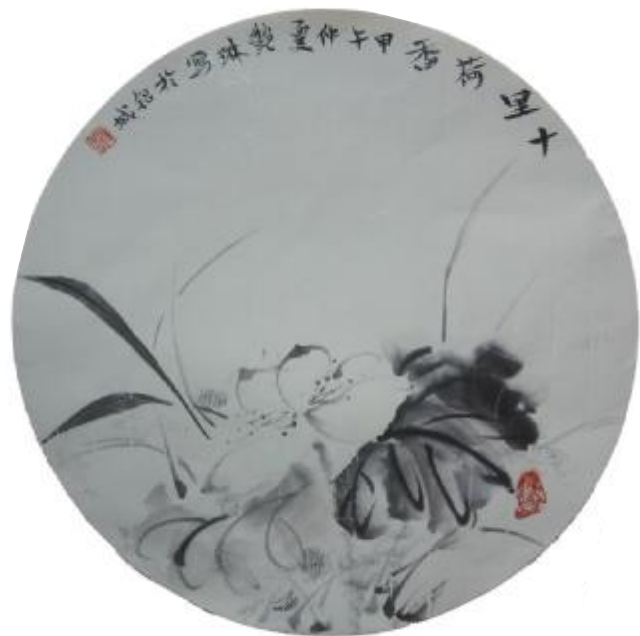
十里荷香 扇面 赵艳琳