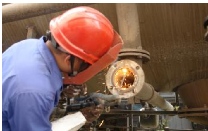
近日,运输部机辆段车辆库员工不畏车库内38℃高温,在严格落实安全防护措施的基础上,严把执行检修作业标准,确保暑运期间每辆罐车检修质量。图为该车间车辆钳工在车体下焊接车辆配件。