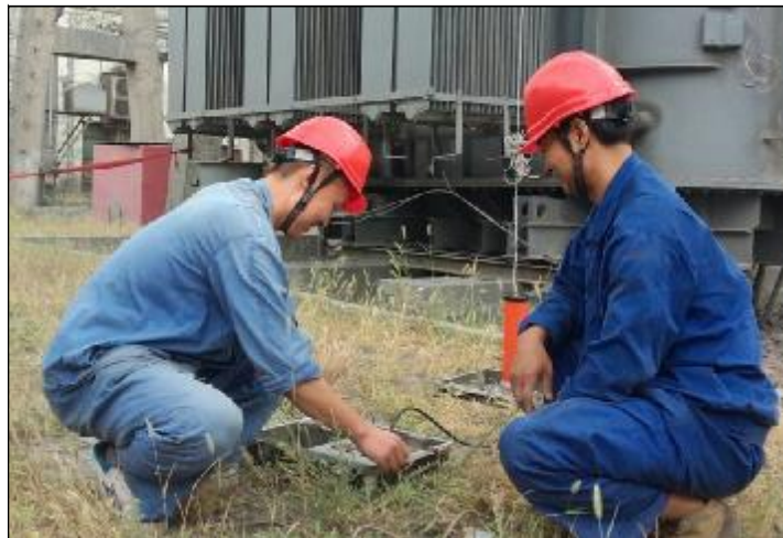
8月5日,水电分厂综合检修车间结合生产实际,维护保养水泥变2号主变,擦拭变压器穿墙套管、对设备除锈刷漆,消除设备隐患,保证正常生产供电。图为检修人员正在做变压器试验。

视频会议后,郭顺喜要求,各单位要深入贯彻会议精神,认真学习刘祥民副总裁讲话精神。他指出,执行规章制度不严,存在侥幸心理是发生习惯性违章的根源,各单位要举一反三,吸取血的教训,狠抓习惯性违章整治工作;要按照“党政同责、一岗双责、齐抓共管”要求,认真研究并加以落实,确保安全生产工作扎实推进。