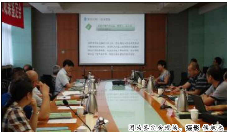
图为鉴定会现场。

本报讯 今年以来,孝义铝矿打破传统独立作业模式,实行剥离、采矿、运输闭环管理,剥采运一体化作业,取得精细开采、自行监管、互利双赢效果,目前,矿石回收率达到了96%以上。